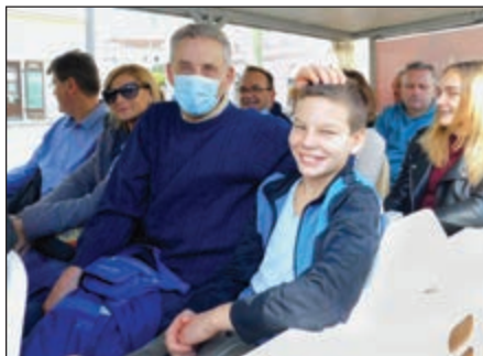
Városi vonaton lehetett Szegeddel ismerkedni