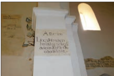
A katolikus templomban református feliratok