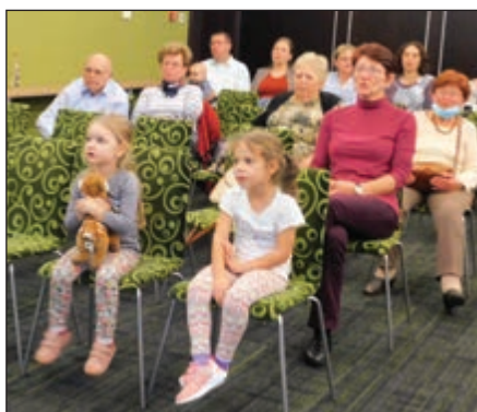
Presbiterink a legfiatalabbakkal

Természetesen némi félelemmel szívünkben hirdettük meg az alkalmat, mert bizonytalan volt, hogy mennyien tudnak és mernek részt venni a Szegedre szervezett kiránduláson. Három héttel az utazás előtt - az első felmérés időpontjában - a Presbitérium 80%-a jelezte utazási és részvételi szándékát. Talán ez volt az első olyan pont, amely mindenkit megdöbentett. Félelemmel tervezgettük az utat, de Isten adott reménységet arra, hogy közelsége elúzi a félelmet. Természetesen ez nem jelentette azt, hogy ne kellett volna a megfelelő járványügyi biztonságról gondoskodni: olyan busszal utaztunk, amely teljes körűen ózongenerátorral volt fertőtleníve. A buszon igyekeztünk a megfe-