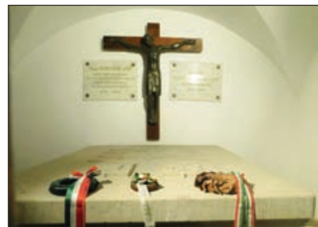
Klebsberg Kunó kriptája az altemplomban