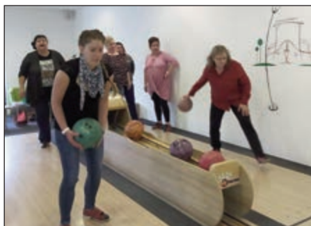
Nagy izgalmakat hozott a tekeverseny