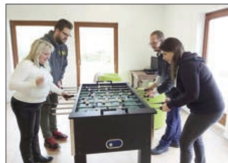
A csocsóviadal is nagyon népszerű volt