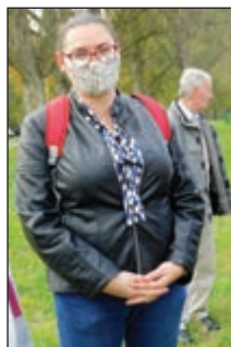
Maszkban a lelkész nő