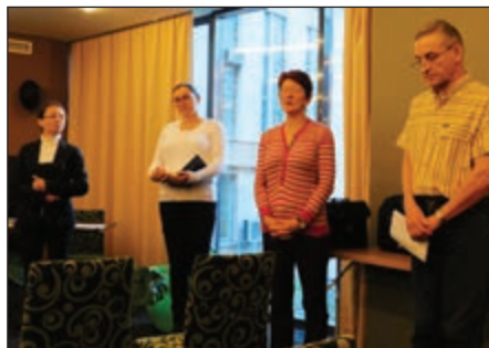
Megemlékezés az 1956-os forradalomról

19. Hogyan értékelhetjük megjelenésünket?