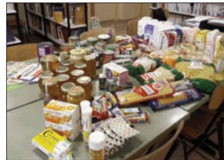
A 12. osztály adománya

vány munkáját ismerték meg a tizenkettedikesek: sok doboznyi élelmiszeradományt gyűjtöttek és vittek el a központjukba.