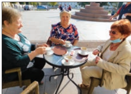
Kávézás a körmendi főtéren

ÍRTA: BICZÓ KATALIN PRESBITER, A KÁROLI KÖR VEZETŐJE