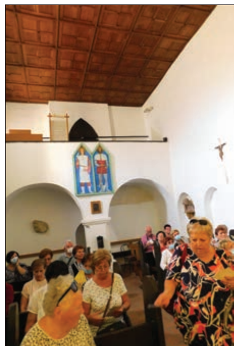
Az őriszentpéteri templomban a kirándulók