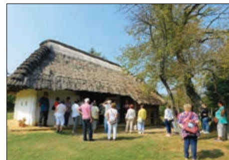
A pityerszeri skanzen