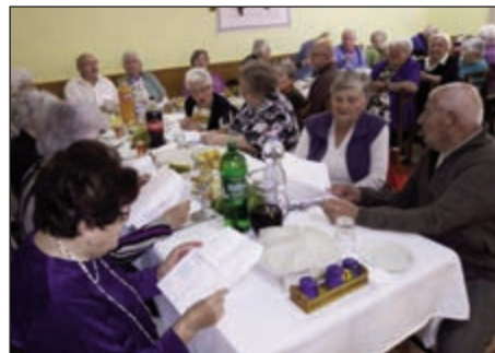
Jól sikerült a szüreti multság

hívta a két idősotthon dolgozóit Hajmásra, a Zselici Szabadidőközpontba. Különleges napot tölthetünk el együtt. Azért is mondható egyedinek, mert az elmúlt 13 évben nem volt rá példa. Köszönhető ez Nagytiszteletű úrnak, aki fontosnak tartotta, hogy az intézmények életében erre is sor kerüljön. Nagy élményben volt mindnyájunknak része. Reggeli áhítattal kezdtünk, majd rövid előadást hallhattunk „A munkánk a hivatásunk” címmel.