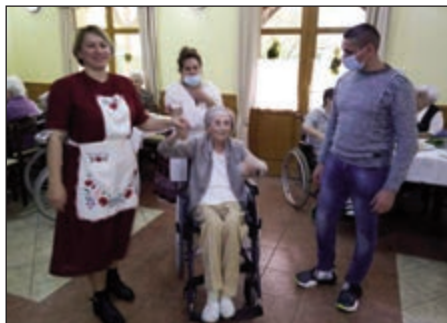
Egy idős otthonlakót köszöntöttek