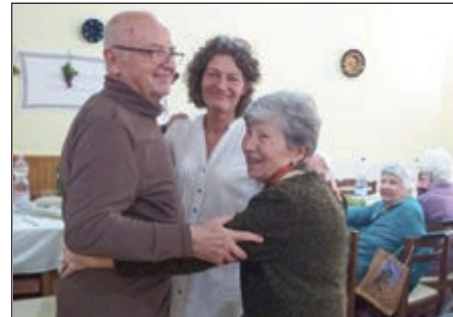
Volt aki táncrea perdült a szüreti alkalmon

Ezek után interaktív „ismerkedős” feladatokat kaptunk, melynek megoldása szintén vidámsággal telt. Volt egy olyan nap, ahol egy kicsit jobban oda tudtunk figyelni egymásra.