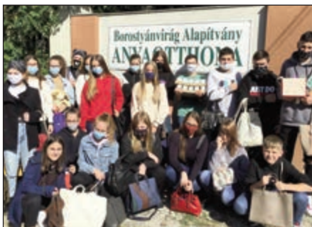
A 9. osztályosok az elkészített csomagokkal