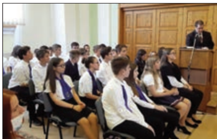
A szombati vizsgán a gyülekezeti házban