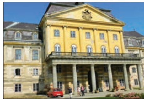
A Batthyány kastély ma múzeum