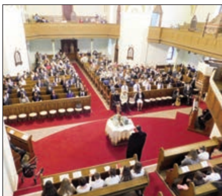
Sokan jelen voltak az ünnepi alkalmon