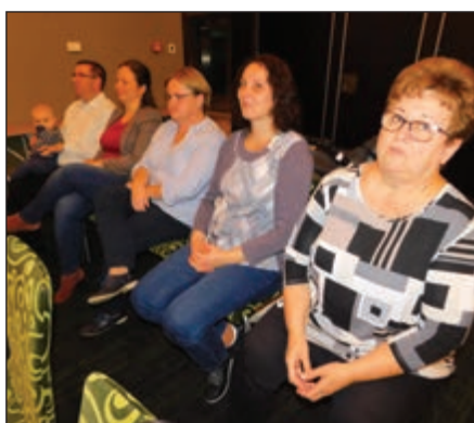
A gyülekezetvezető a pedagógusokkal