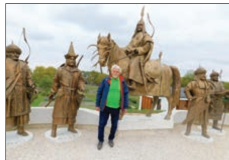
Ópusztaszer. A vezérek előtt fotósunk

hogy egy Presbitérium 16 reális és jól átgondolt célt meg tud fogalmazni. Már önmagában az hatalmas eredmény, hogy a presbiterek tudták a saját gyülekezetük helyzetét teljesen objektíven értékelni és kimondani, hogy mely területek azok, ahol szükség van az előrelépésre vagy éppen a megerősödéssre. És már önmagában azért érdemes volt részt venni az alkalmon, hogy szembesüljünk az értékeinkkel, hiszen ahol ismerik az értékeket, ott lesznek célok és ott lesz egyértelmű a haladás iránya is. Mindezeket túl pedig nagyon is időszerű volt a Presbitérium számára egy olyan közösségformáló hétvége, amikor is jobban megismertük egymást és ezáltal a jövőben egy kicsit jobban benne lehet-