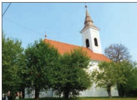
A szalafői református templom