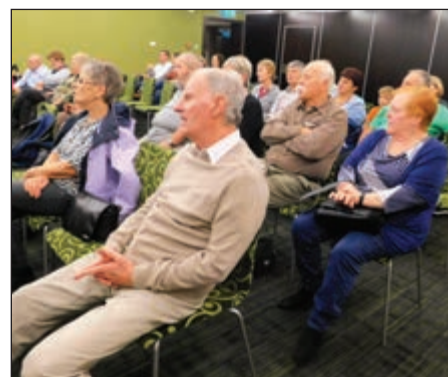
Az előadásokat nagy figyelem övezte