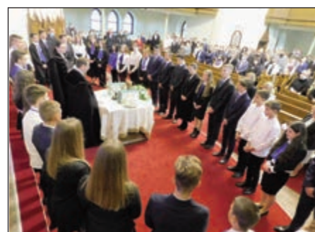
Az úrasztalát körbeállták a konfirmandusok