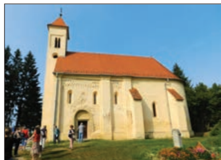
Az 1250-ben épült Árpád-kori templom