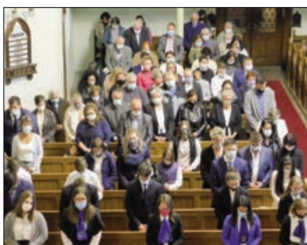
A járvány miatt mindenki maszkot viselt

rekek családjainak támogatása is. Részben a gyerekeken keresztül, részben pedig személyen megismertetni és elfogadtatni velük konfirmációnkat. Éppen ezért most két kedves édesanya és család írásán keresztül szeretnénk ezeket a kötődéseket kicsit bemutatni. (A 7. oldalon olvashatják.)