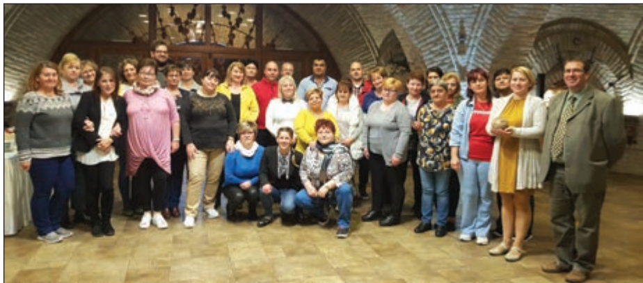
A hajmási találkozó közelebb hozta egymáshoz az Ikafalvi és a Csertán Otthon dolgozóit