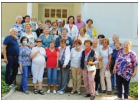
Csoportkép a körmendi vadászház előtt