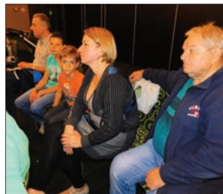
A hivatalvezető és az otthonvezető